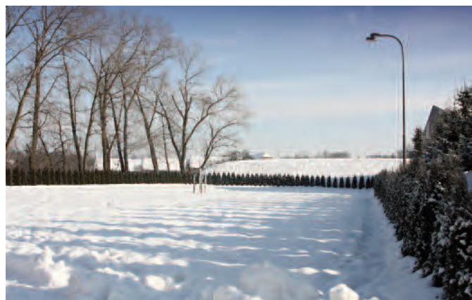
Nové kolbiště má rozměry 65 x 25 metrů. Povrch z textilií vystřídala sněhová nadílka...