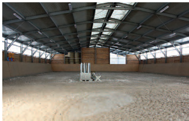
Prostorná hala (60 x 21 metrů) je dominantou areálu.