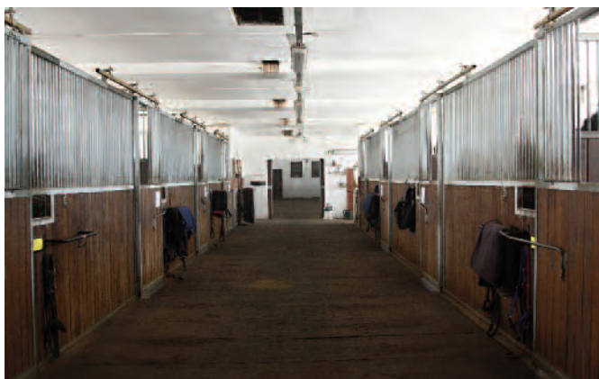
Kapacita stájí je 24 boxů (plus 6 venkovních). Praktická je 4 m široká ulička.