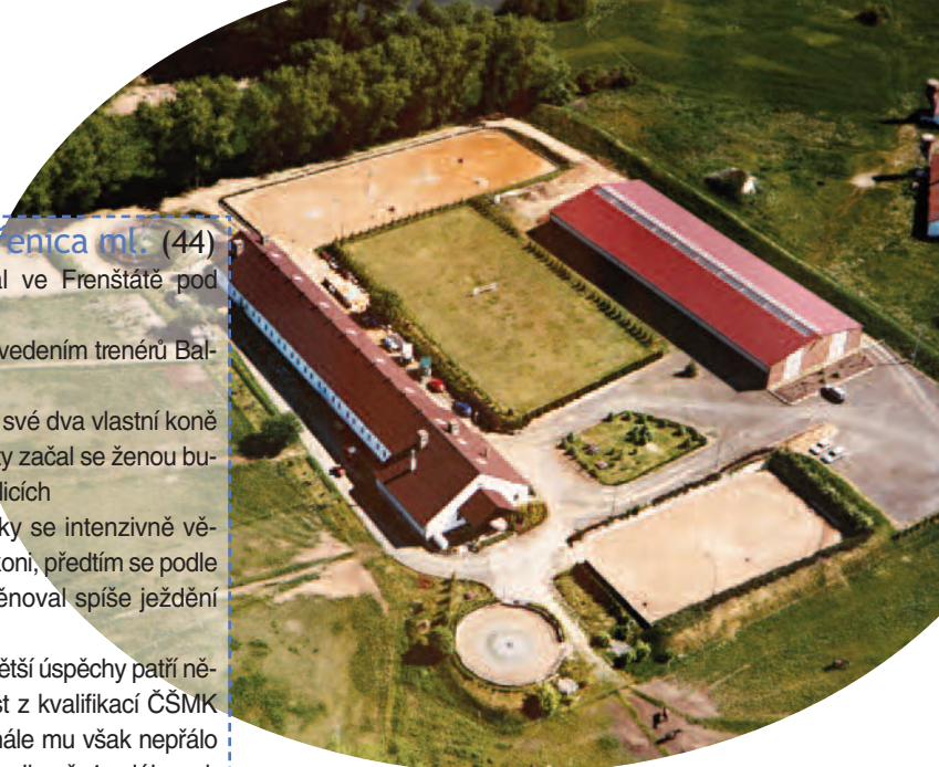
Poněkud „letnější“ pohled na areál v Sulicích...